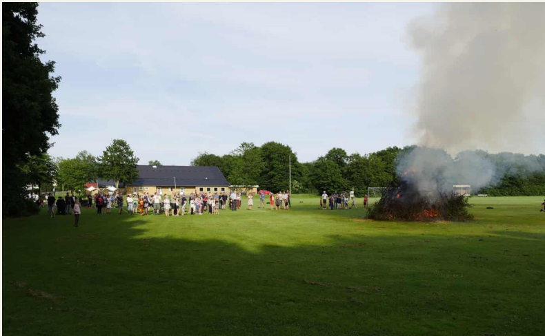
Arrangementet blev afviklet ved Gesten Fritidscenter, og der var gang i både bålet og hyggen.