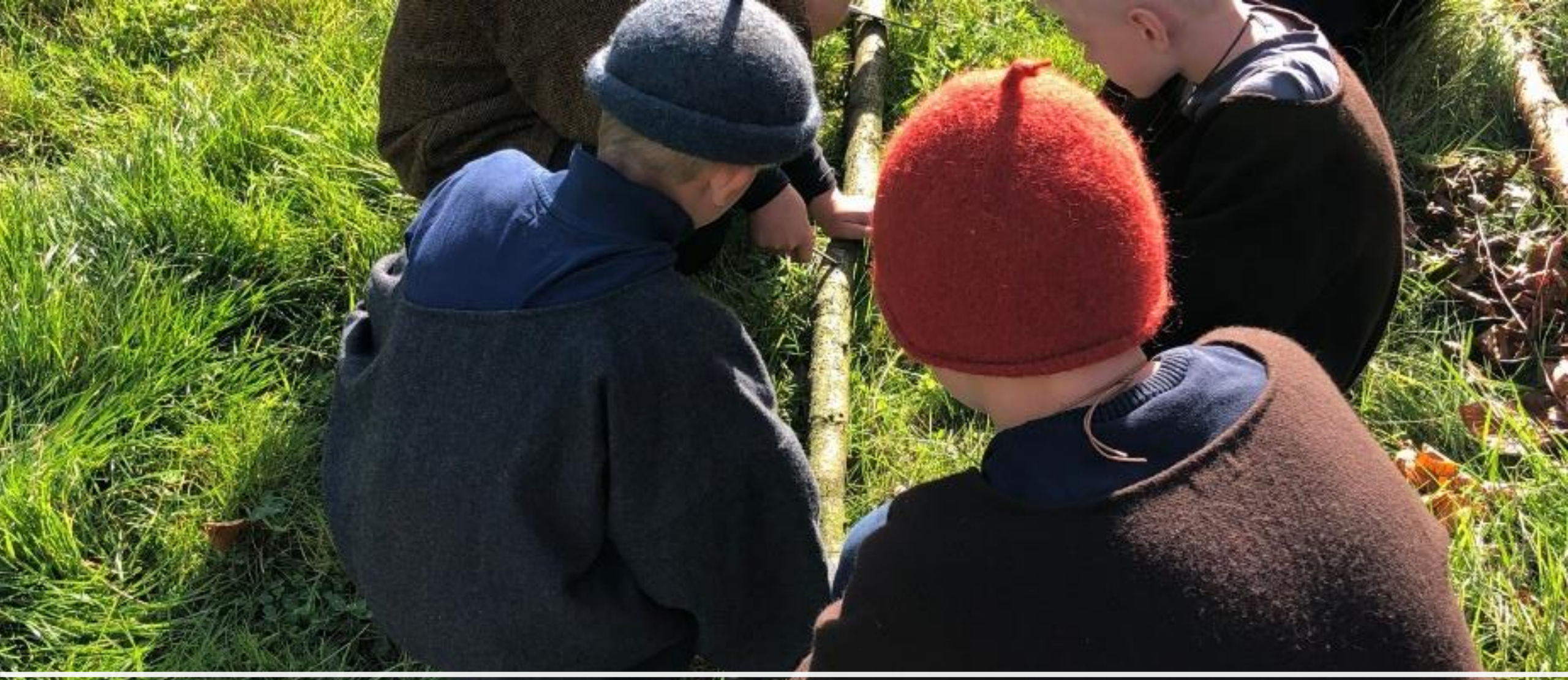
Drenge: Hente Odinsfigur (birketræ) og snitte runer i træet