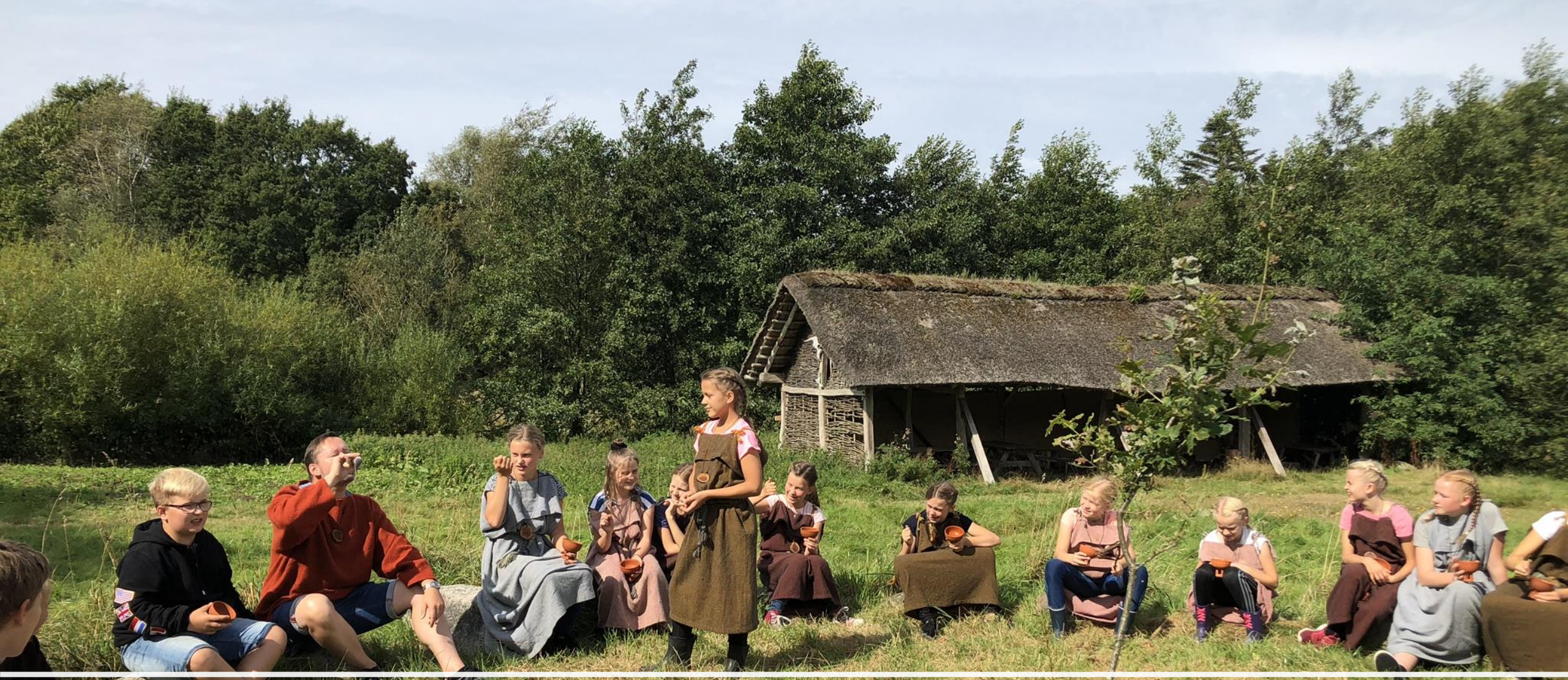
Fælles fejring af ofring ved at skåle i børnemjød på højen (pigerne serverer)