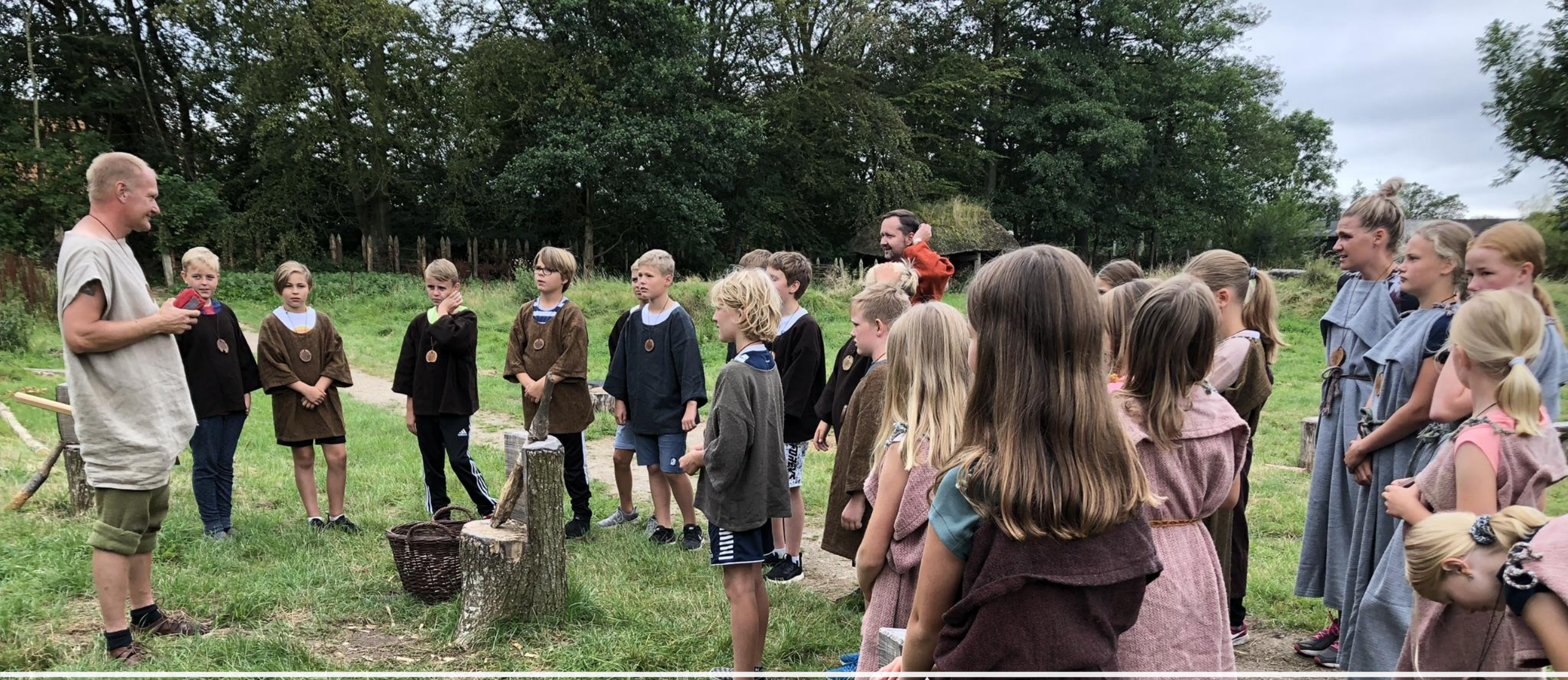
Sikkerhedsinstruks i brug af økser og knive